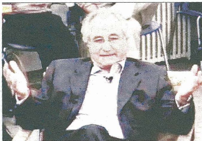
Bernie Madoff, l'artefice della «truffa del secolo»

che alcuni fondi della sua unità dedicata agli investimenti alternativi sono risultati esposti a Madoff indirettamente tramite feeder funds. Questi ultimi però - precisa una nota - non sono tuttavia presenti in alcun portafoglio dei fondi di hedge di diritto italiano». Per Banco Popolare il crac «comporterà - ha spiegato la banca in una nota - una perdita massima non superiore, al cambio attuale, a 8 milioni di euro». Invece, «la perdita massima sui fondi distribuiti a clientela istituzionale e private - ha aggiunto il comunicato - ammonta a circa 60 milioni». Banco Popolare ha specificato che la controllata Aletti Gestie Alternative «ha esclusivamente una esposizione indiretta su Madoff, tramite fondi feeder inseriti nei propri fondi di hedge». Mediobanca ha fatto sapere in serata di avere una esposizione di 670 mila dollari tramite Monegasque de Banque. Nessuna esposizione invece per Intesa Sanpaolo, Mps, Generali. Pesante la situazione per altri grandi del credito. Il caso più eclatante resta quello del Santander, che ha ammesso 2,3 miliardi di euro di esposizione della propria clientela verso i fondi di Madoff. Rischi per 370 milioni invece per Bnp Paribas - che affonda di oltre il 10% a Parigi -, per oltre 400 per Rbs. Poi ancora, in ordine sparso: